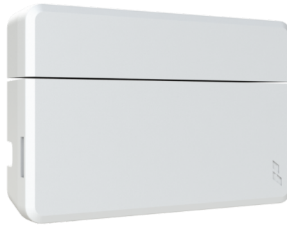
Figura 1: Sensor magnético MAG 915 Radioenge

O sensor magnético MAG 915 Radioenge opera com comunicação sem fio bidirecional criptografada, assegurando a confirmação de recebimento de cada detecção pela Receptora RX 915 e pelas Centrais de Alarme Radioenge, garantindo também a segurança das informações transmitidas e impossibilitando qualquer tentativa de clonagem ou sniffing .